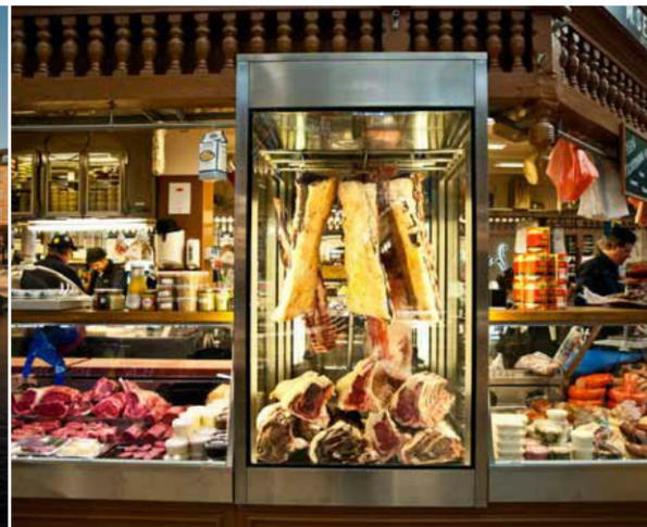
Clockwise, from top Gamla stan